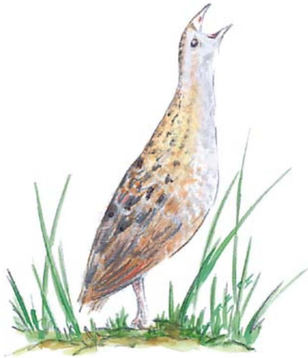
Grieze Crex crex Zīmējuma autore: Ditta Zagorska