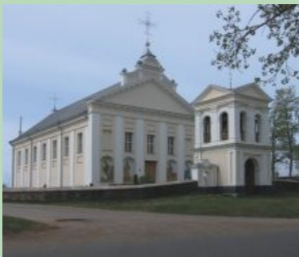
Bebrenes Sv. Jāņa Kristītāja katoļu baznīcas veidolā saskatāmas klasicisma iezīmes, bet tās interjers veidots baroka stilā

Dvietes senleja ir viena no senākajām apdzīvotajām vietām Latvijas teritorijā – pirmie iedzīvotāji te ienākuši jau ledus laikmeta beigās apmēram pirms 11 tūkstošiem gadu. Te atklātās akmens laikmeta apmetnes ir senākās cilvēku apmetnes vietas Sēlijas novadā. Agrā dzelzs laikmeta pilskalns (galvenokārt Pilskalnes pagastā), vēlā dzelzs laikmeta apmetņu un senkapu, kā arī viduslaiku apmetņu vietas un atsevišķi arheoloģiskie savrupatradumi stāsta par teritorijas pamatiedzīvotāju sēļu – vienas no četrām baltu ciltīm, no kurām vēlāk veidojās latviešu tauta, sadzīvi, tradīcijām, pasaules redzējumu. Ceļotājiem ir vērts iepazīt arī klasicisma stilā veidoto Dvietes muižas apbūves centru un 19.gs. vidū celto laukakmeņu tiltu. Bebreņē apskatāms 19.gs. vidū celtais grāfu Plāteru-Zībergu muižas komplekss ar parku un Akmeņupes