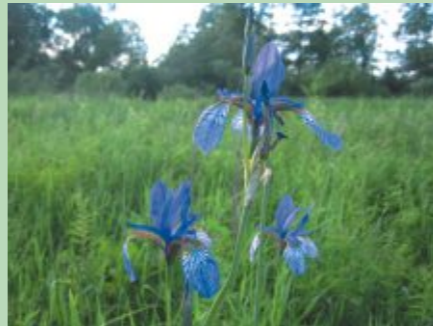
Nosusināšanas un pļavu kultivēšanas dēļ izzūdošā Sibīrijas skalbe iekļauta īpaši aizsargājamo sugu sarakstā

Dvietes palienes īpašā hidroloģiskā režīma dēļ te labi jūtas mitrājiem tipiskas augu sugas, to skaitā astoņas īpaši aizsargājamas - atvašu saulrietenis, stāvā vilkakūla, kas te veido arī īpaši aizsargājamo dzīvotni - stāvās vilkakūlas pļavas, trīs orhideju sugas - Baltijas dzegužpirkstīte, stāvlapu dzegužpirkstīte un plankumainā dzegužpirkstīte, jumstiņu gladiola, mānīgā knīdija, Sibīrijas skalbe.