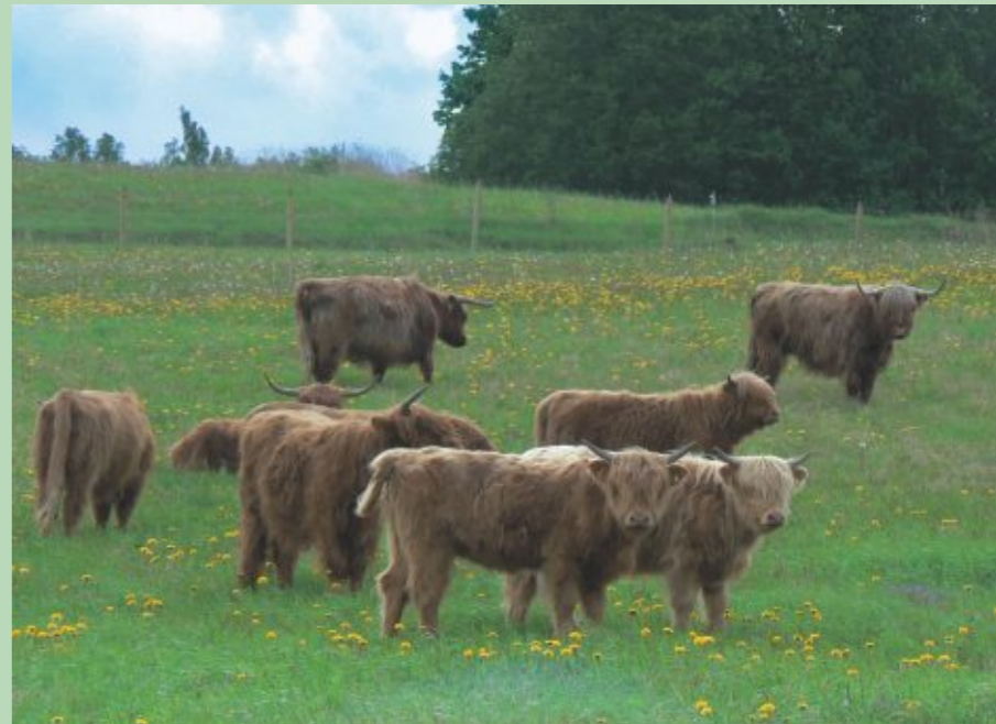
Dabisko palieņu pļavu neaizaugšanu ar krūmiem palīdz nodrošināt arī lielie zālēdāji