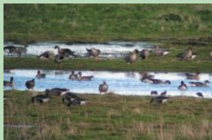
Dvietes palienē pavasara migrāciju laikā atpūšas tūkstošiem ūdensputnu

Dvietes paliene ir viena no daudzveidīgākajām un bagātākajām putnu vietām Latvijā, nozīmīga caurceļojošo ūdensputnu pulcēšanās vieta pavasarī un svarīga ligzdošanas vieta. 2005. gada pavasarī Dvietes palienē novērotu ūdensputnu kopējais skaits novērtēts kā vismaz 25 - 30 tūkstoši migrējošo putnu vienlaikus, tālab tā atzīta par globālas nozīmes putnu pulcēšanās vietu. Pavisam dabas parka teritorijā šobrīd zināmas vairāk nekā 40 Latvijā vai Eiropā īpaši aizsargājamas putnu sugas. Dvietes paliene ir viena no labākajām ormaniša, griezes un ķikuta ligzdošanas vietām Latvijā. Putnu vērotājiem uz Dvietes palieni iepazīt dabas parka putnu bagātību vislabāk doties putnu pavasara migrācijas laikā - aprīlī un maija sākumā.