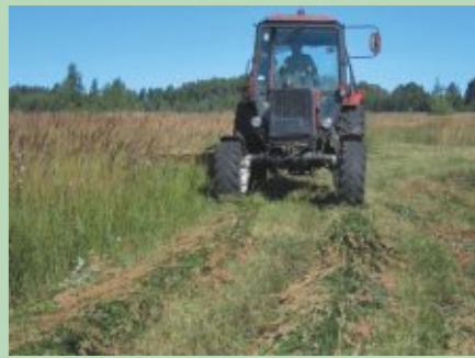
Vēļā pļaušana, sākot ar jūlija vidu, ļauj pasargāt putnu ligzdas un mazuļus

Īpaša vieta dabas aizsardzības pasākumu klāstā atvēlēta palieņu pļavu vēļajai pļaujai. Pļavu putniem agra zālāju pļaušana nodara postu - iznīcina ligzdas, sapļauj nelidojošos mazuļus. Ievērojot dzīvniekiem draudzīgus pļaušanas termiņus un metodes, ir iespējams novērst putnu sugu daudzveidības un skaita samazināšanos. Labi pļavu „apsaimniekotāji” ir arī lielie zālēdāji. Dabisko palienes pļavu noganīšana ar lielajiem zālēdājiem ir nozīmīgs dabas daudzveidības saglabāšanas pasākums, jo mitrās un ciņainās pļavas, ko agrāk pļāva ar rokām, mehānizēti apkopt ir gandrīz neiespējami. Tās pakāpeniski aizaug, samazinās augiem un dzīvniekiem piemērotu dzīvotņu platības. Tāpēc Dvietes palienē kopš 2006. gada dzīvo Hailander šķirnes liellopi un Konik Polski šķirnes savvaļas zirgi, kuru galvenais darbs būs uzturēt atklātas citādi nenoplūjamās palieņu pļavas.