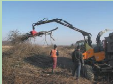
Krūmu ciršana jāveic pirms vai pēc putnu ligzdošanas sezonas, lai tiem netraucētu