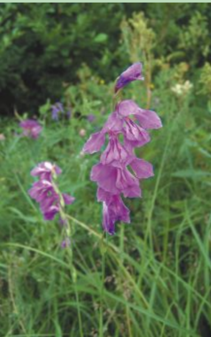
Retā jumstiņu gladiola 2006. gadā atzīta par Latvijas Gada augu

Dvietes palienes īpašā hidroloģiskā režīma dēļ te labi jūtas mitrājiem tipiskas augu sugas, to skaitā astoņas īpaši aizsargājamas - atvašu saulrietenis, stāvā vilkakūla, kas te veido arī īpaši aizsargājamo dzīvotni - stāvās vilkakūlas pļavas, trīs orhideju sugas - Baltijas dzegužpirkstīte, stāvlapu dzegužpirkstīte un plankumainā dzegužpirkstīte, jumstiņu gladiola, mānīgā knīdija, Sibīrijas skalbe.