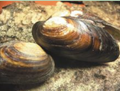
Biezās perlamutrenes atradnes Dvietes upē liecina, ka ūdens tajā joprojām ir pietiekami tīrs