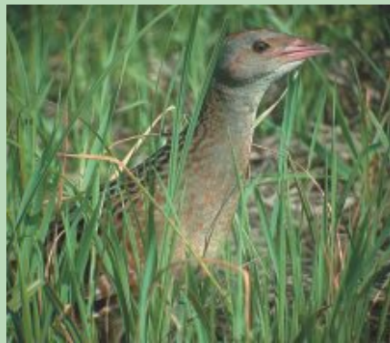
Griezei Dvietes paliene ir viena no labākajām ligzdošanas vietām Latvijā