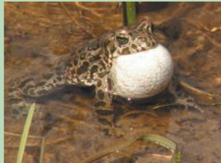
Zaļais krupis Latvijā sasniedz sava izplatības areāla ziemeļu robežu. Retais dzīvnieks sastopams arī Dvietes palienē

Dabas parka austrumu daļā no Dvietes ezera līdz Daugavai sastopamas vismaz astoņas Latvijā īpaši aizsargājamas bezmugurkaulnieku sugas. Plaši izplatīts lielais gludgliemezis, mirdzošā ūdensspolīte. Dvietes palienē sastopama arī tipiska meža gliemežu suga - krokļūpas vārpstīngliemezis, kas ir maz ietekmētu, dabisku mežu indikators.