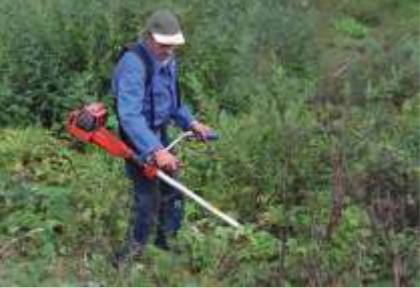
Grauzu pļavu atjaunošana

Dabas parka ‘‘Svētes paliene’’ teritorija jau sen bijusi pakļauta cilvēka saimnieciskai darbībai. Līdz 2. pasaules karam tā bija salīdzinoši maz ietekmēta. Taču pēc tam Lielupes