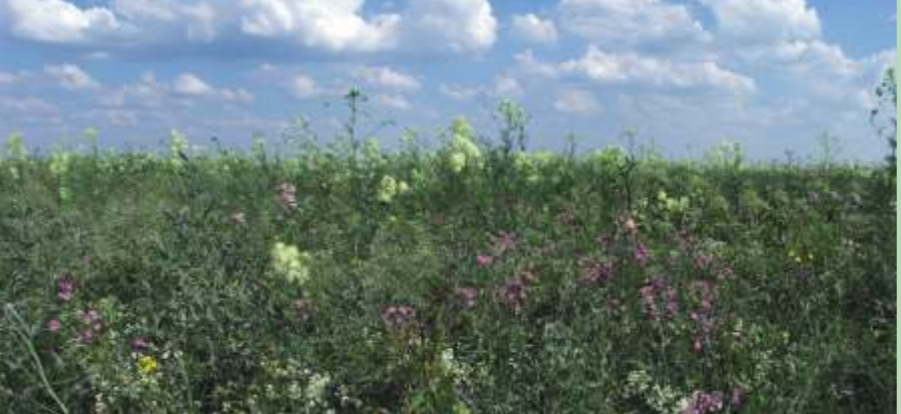
Lielā nozīme vietas īpašajam statusam ir regulāriem pavasara palieim. Grauzu pļavas Svētes kreisajā krastā.

Upju palieņu pļavas raksturīgas ar biezu augāju, kas pielāgojies augšanai pastiprinātos mitruma apstākļos.