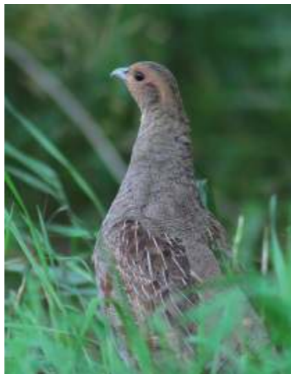
Grey Partridge Perdix perdix .

In spring migration time geese are found in high number in the territory of the Nature Park and surroundings. The highest number of 16000 geese (Tundra Bean Goose Anser f. rossicus and White-fronted Goose Anser albifrons ) was counted 7th of April