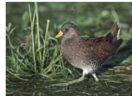
Spotted Crake Porzana porzana .

Among migrating wading birds most often observed are the Lapwing Vanelus vanelus (up to 2000 birds), the Curlew Numenius arquata , the Golden Plover Pluvialis apricaria , the Redshank Tringa totanus , the Ruff Philomachus pugnax , the Common Snipe Gallinago gallinago etc.