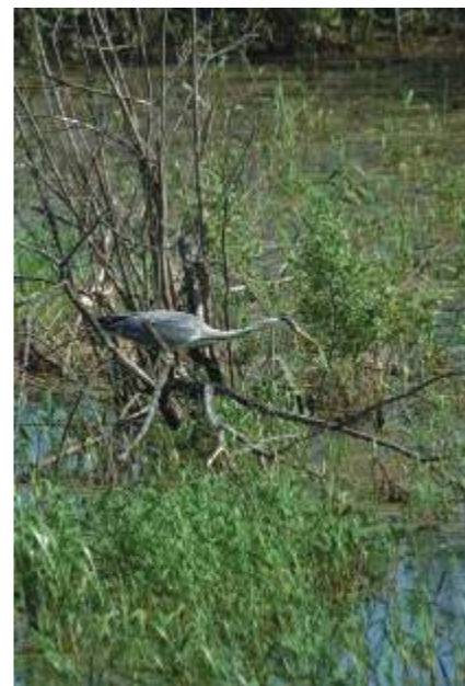
Grey Heron Ardea cinerea feeding in old oxbow of Lielupe River.