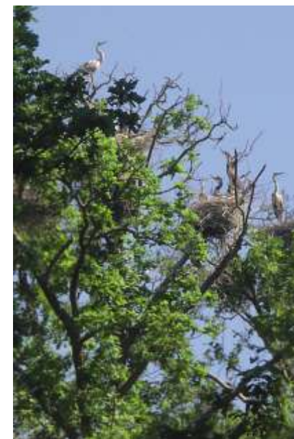
Zivju gārņu kolonija ozolu audzē. Colony of nesting grey herons Ardea cinerea in oak tree forest.

Territory of the Nature Reserve “Durbes ezera pļavas” is not quite popular between tourists, though nature lovers and birdwatchers could visit it, keeping themselves attentive to surrounding nature.