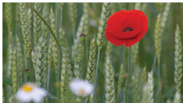
Ekstensīvi apsaimniekotās aramzemes līdzās labībai vienmēr atrodas vieta arī citiem augiem.