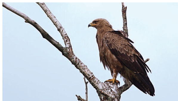
Mazais ērglis ir viens no lauku-mežu mozaikas simboliem.