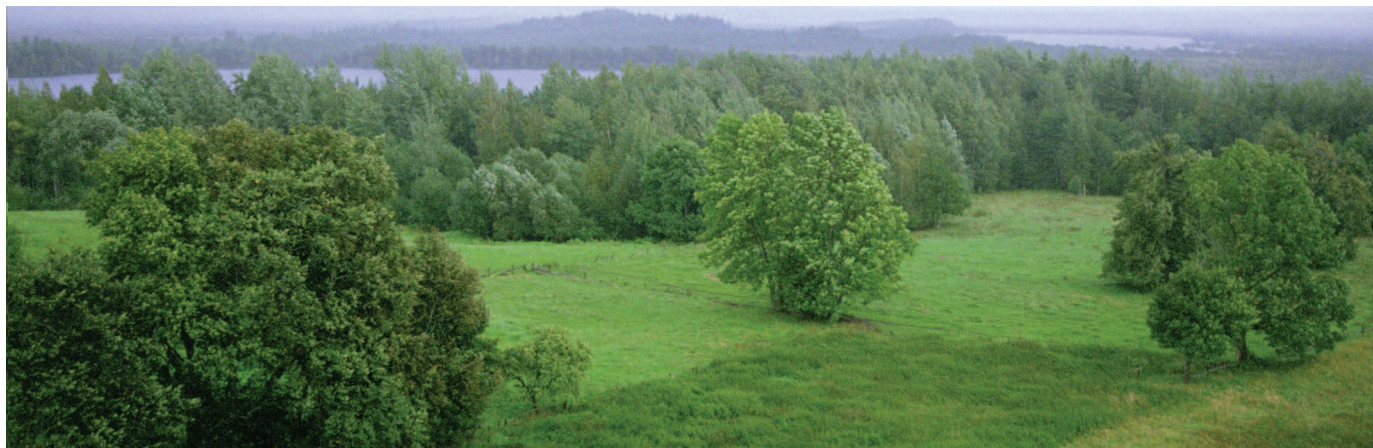
Zālāju, lauksaimniecības kultūru un ainavas elementu mozaika.