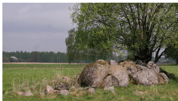
Akmeņu krāvumi un krūmu puduri lauku ainavā ir nozīmīgas dzīvotnes dažādām savvaļas sugām.